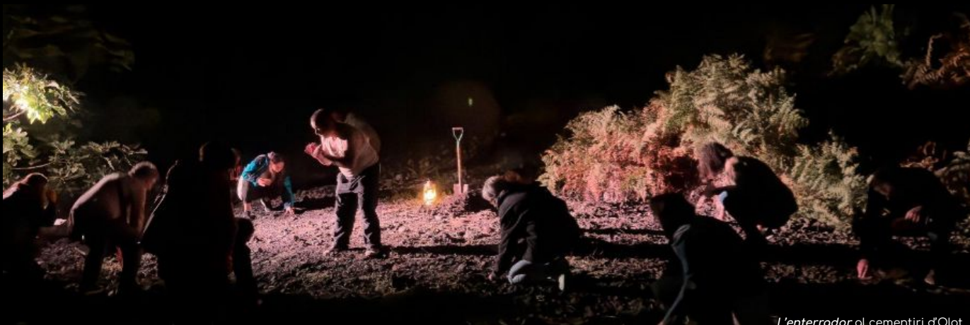
L'enterrador al cementiri d'Olot