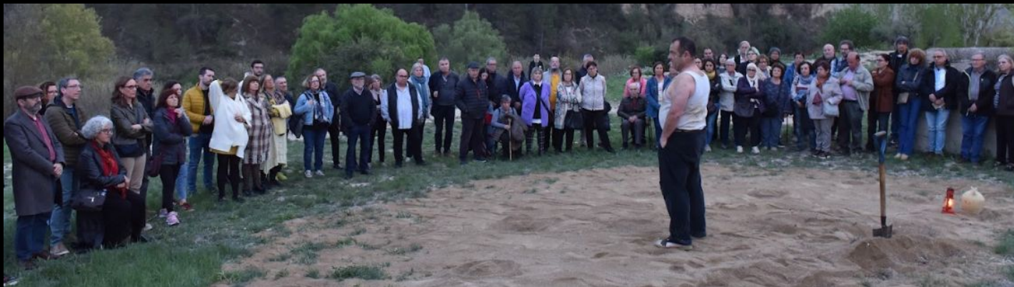
L'enterrador al cementiri d'Igualada