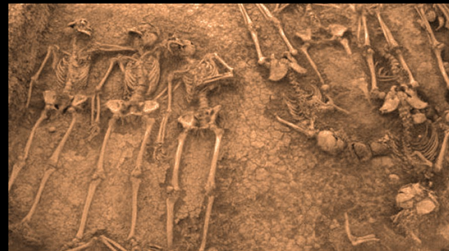
exhumació de cadàvers a les fosses del cementiri de Paterna